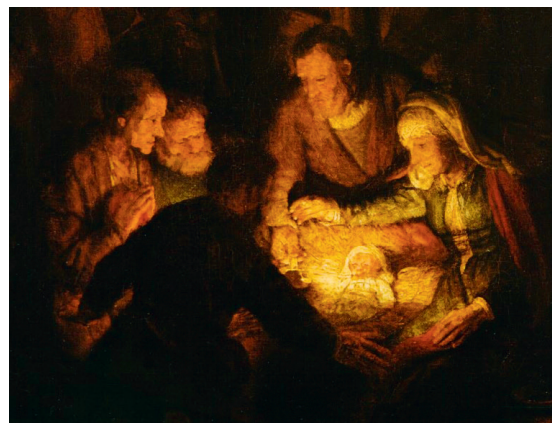
Rembrandt: Die Anbetung der Hirten.