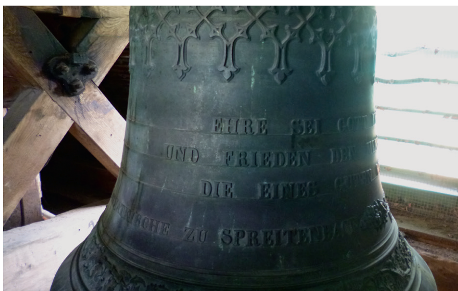
Grösste von drei Glocken der reformierten Dorfkirche Spreitenbach. Gegossen 1878 von Jakob Keller in Zürich.

In Ihren Händen halten Sie die erste Ausgabe unseres neu gestalteten Gemeindeblatts. Sein Name «Glockenspiel» verweist auf eine Besonderheit unserer Kirchgemeinde, besitzen wir doch im Kirchenzentrum Hasel ein eigenes Glockenspiel. Von den 62 in der Schweiz vorhandenen Glockenspielen sind nur deren sieben grösser als unseres, zwei weitere sind gleich gross und ebenfalls mit 24 Glocken ausgestattet.